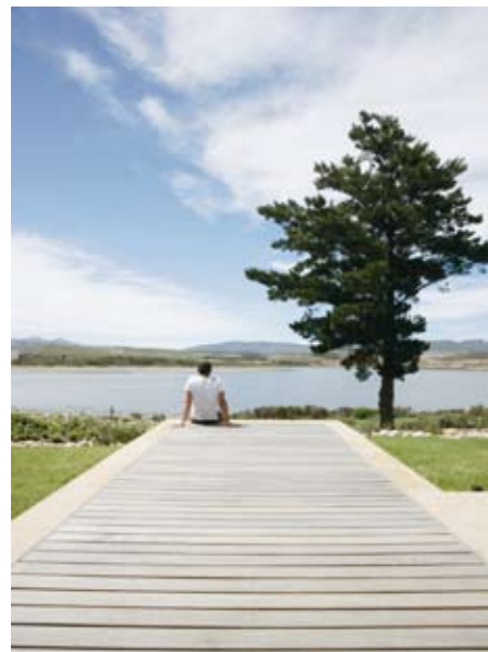
MADSVIUFF har funnet paradiset for seg og sin familie.