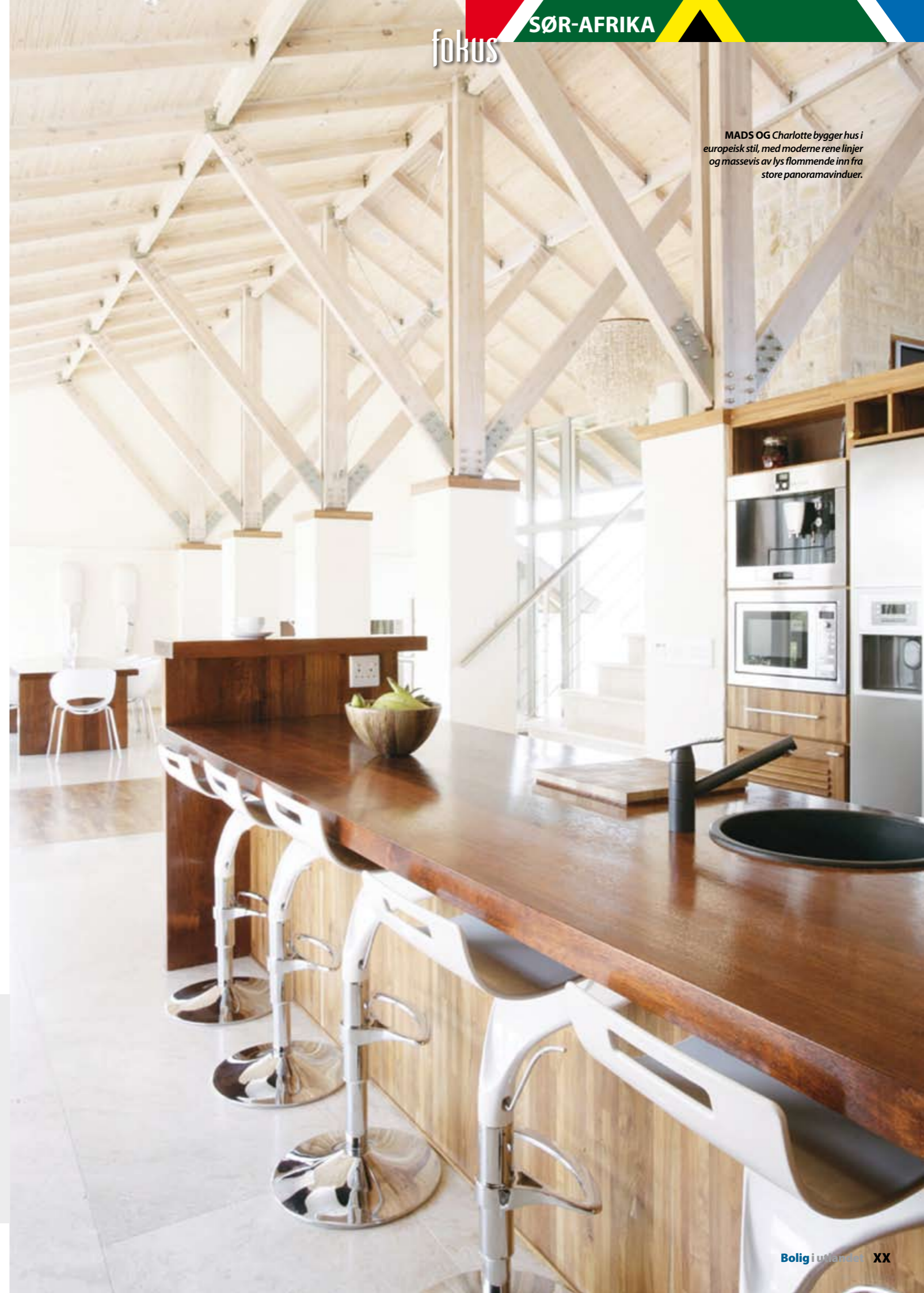
MADS OG Charlotte bygger hus i europeisk stil, med moderne rene linjer og massevis av lys flommende inn fra store panoramavinduer.